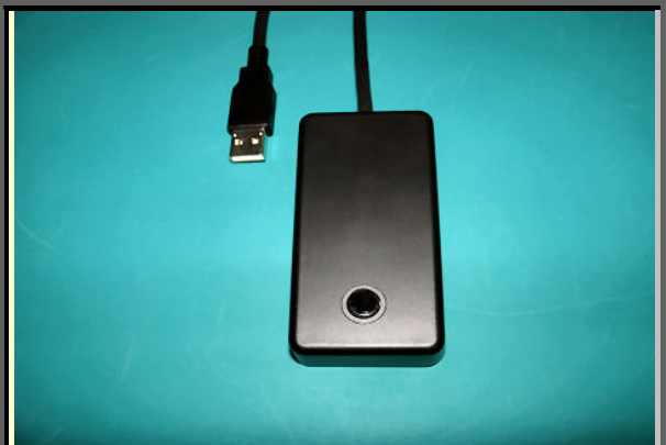
USB-SWBOXs 黒/KM or/C