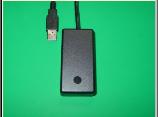
USB-SWBOXc /KM or/C (●印は SW 位置目安)