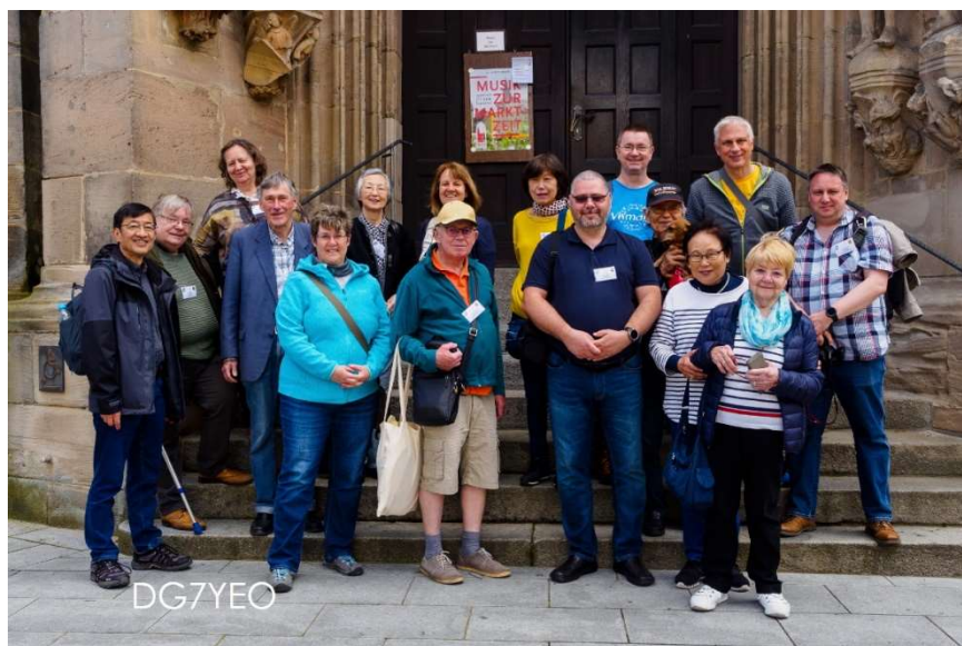
Vor der Moritzkirche モーリッツ教会前で