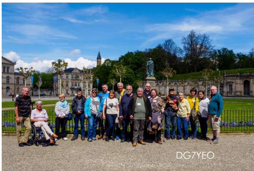
Beim Schloss Ehrenburg エーレンブルク城前庭で

翌7日はお別れの日です。朝食で一堂に集まった皆さんと、食事をしながら挨拶を交わし、来年も元気で会えるように約束してお別れしました。